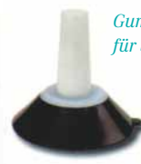
Gummissauger für Styroporkopf